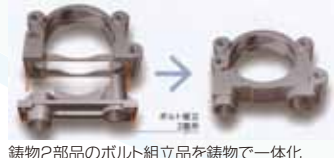
鋳物2部品のボルト組立品を鋳物で一体化

別品鋳物は、溶接組立品や複数部品、切削加工品を、従来工法から鋳物代替品へ切り替えるサービスです。鋳物に切り替えることで大幅なコストダウンにつながるケースがあります。さらに、溶接作業・組立作業・個々の部品管理が不要。寸法精度向上や安定した強度が得られます。また、切削加工品からの切替の場合、切削量が大幅に減少し、切削加工時間の短縮や材料費の節約もできます。是非、ご相談ください。