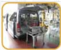
キャラバンカーでの破碎機の出張デモイメージ

遠藤工業では、破碎機を車に積み込んでお客様を訪問し、現地で破碎デモを行っております。「切粉の頻繁な回収で作業効率が悪い」「切粉がコンベヤに詰まって手間がかかる」「リサイクルもしたいが、分離が難しい」などのお悩みを破碎機が解決いたします。二軸破碎機のEC12-20II型と、一軸破碎機のECS17-42型を積み込んで訪問、実際に破碎の様子をご覧くださいことができます。