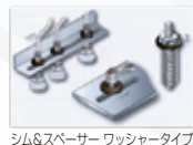
シム&スペーサーワッシャータイプ

シム&スペーサーワッシャータイプは、ボルトなどの座金、スプリングのストッパーとして最適な製品です。ユーザー様からのご注文が多く、特注対応していましたが、このたび全333アイテムを標準化されました。また、マスキングパーツ事例集も発刊されました。自動車部品や産業機器・建設機器など、さまざまな分野で幅広く使われている事例が紹介されています。繰り返しの使用が可能で、工具不要・取外しが簡単。スピーディーにマスキングができ、高い塗装品質を実現します。