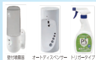
壁付噴霧器 オートディスペンサー トリガータイプ

ノロウイルス抑制3点セットは、感染症ノロウイルスの多くの感染場所となっているトイレに特化した3点セットです。壁付噴霧器、オートディスペンサー、トリガータイプの3点セットで、3点全てに推奨機能水「食添・ピースガード」を使用します。食品工場をはじめ、プロの食品現場で、多数の使用実績があります。是非ご用命ください。