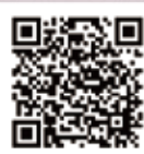
グラインドレーサ(GRM)の詳細はこちらから グラインドレーサ(GRM)の使用イメージ

グラインドレーサ(GRM)は、ダクトを設置するだけですぐ使用できる研磨機・研削盤用ミスト・ダスト回収機です。インバータを搭載していますので、风量調節が可能です。また、キャスター付で簡単に移動可能。防爆モータも搭載可能です。平面研削盤、円筒研削盤、内面研削盤、センタレスグラインダ等のミスト・ダスト(研磨粉)回収に最適です。