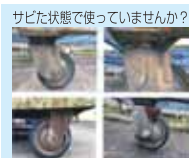
サビた状態では使っていませんか? 従来品(ユニクロメック)