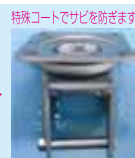
特殊コートでサビを防ぎます! 超耐腐食コート品

適合するストッパー付旋回キャスターや、金具の表面に特殊コートを施しステンレス製並みの耐腐食性能を持つ超耐腐食コート付重荷重用キャスターが新たに掲載されています。