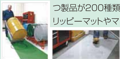
マンモスグリーンマット グリッピーマット

イー・エム・プロダクツより新カタログが発刊されました。新商品を含め漏洩対策に役立つ製品が200種類以上掲載されています。2017年に新発売されたグリッピーマットやマンモスグリーンマットのカットタイプは、大好評をいただき売れ筋商品となっています。吸収材製造のリーダーであるピグブランドの高品質な製品を、是非ご覧ください。