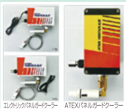
エレクトリックパネルガードクーラー ATEX(パネルガードクーラー)

虹技のトランスベクターやボルテックスチューブ等を掲載した製品カタログが刷新されました。温調付の制御盤用クーラー「エレクトリックパネルガードクーラーA/C」や、海外にてATEX指令を取得した制御盤用防爆型クーラー「ATEX VORTEX A/C」など注目の新製品も新たに掲載されています。